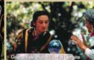
Gruppo Folclorico di Buti di Donato