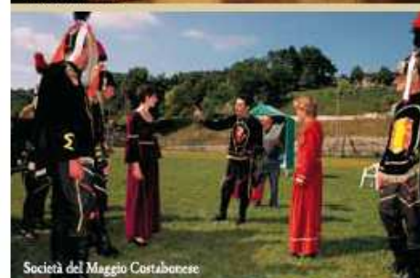
Società del Maggio Costabonese