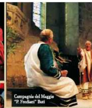
Compagnia del Maggio "P. Frediani" Buti