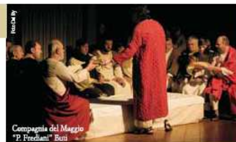
Compagnia del Maggio "P. Frediani" Buti