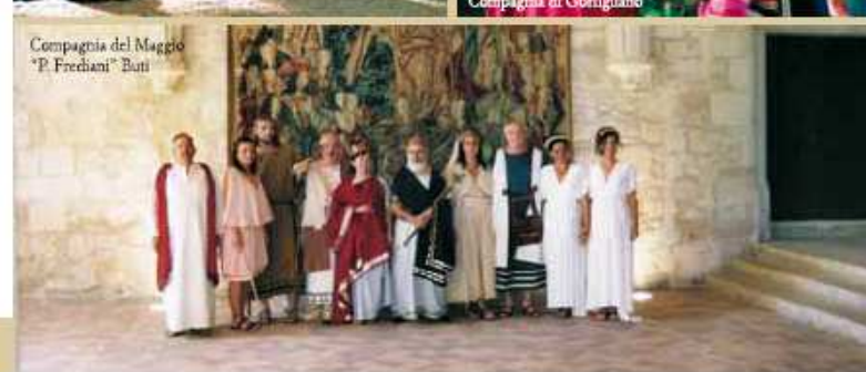
Compagnia del Maggio "P. Frediani" Buti