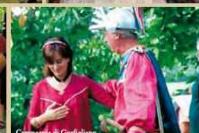
Compagnia di Gorfigliano