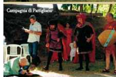
Compagnia di Partigliano